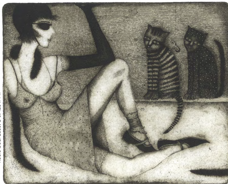
Kocie bca. 2005. C 3, 120 x 149