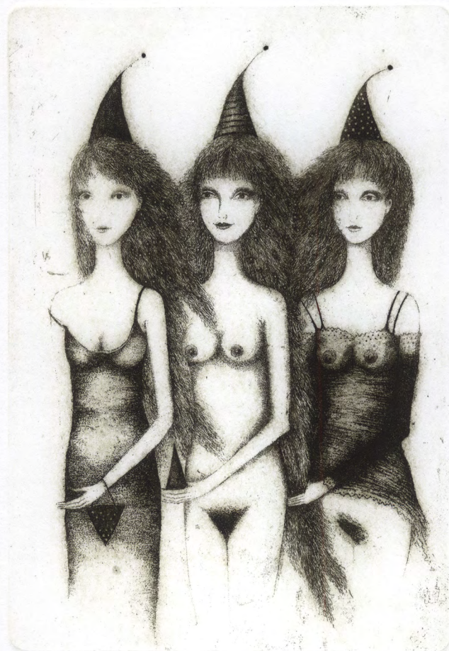
Muzy z Chamonix. C 3, 142 x 99