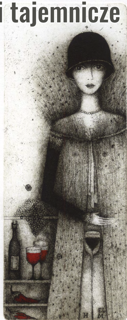
El HM. Dama Bankietowa. C 3 + col., 169 x 67