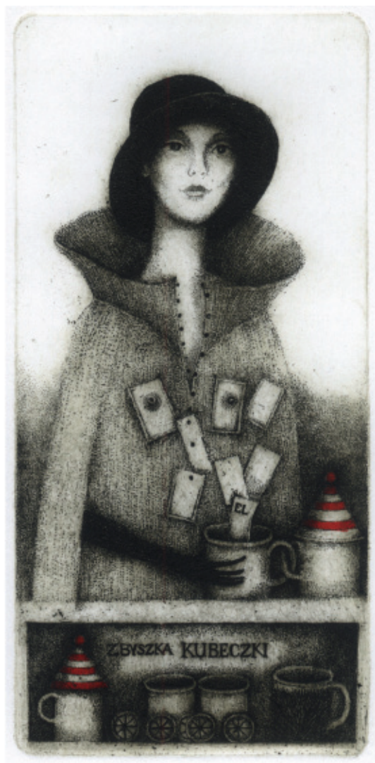
El Zbyszka Kubeczki. 2010, C 3 + col., 137 x 66