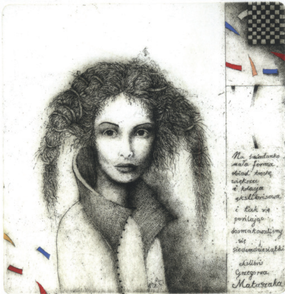
Ekslibris Grzegorza Matuszaka. 2010, C 3 + col., 127 x 125