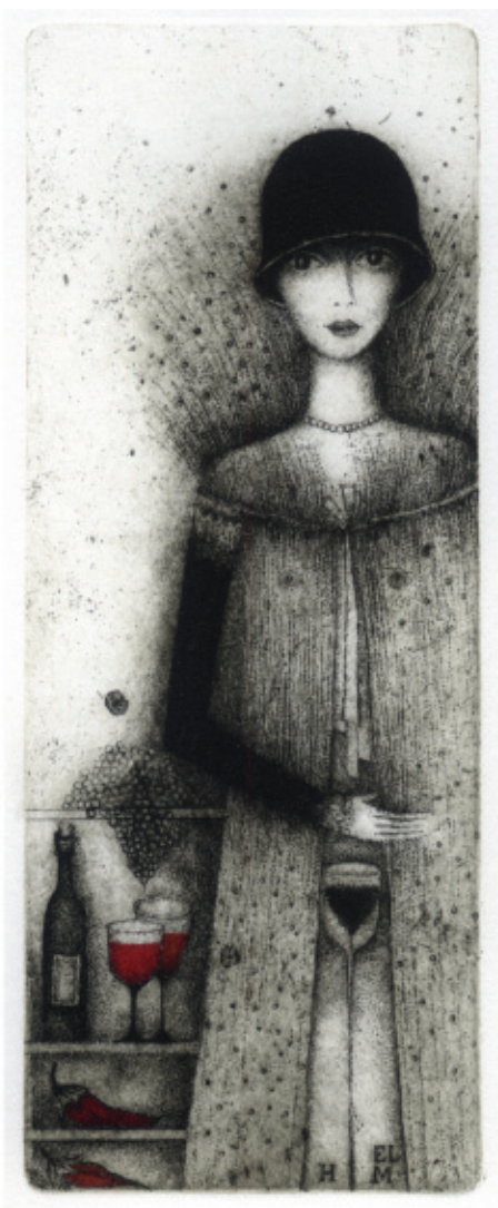
El HM. Dama Bankietowa . C 3 + col., 169 x 67