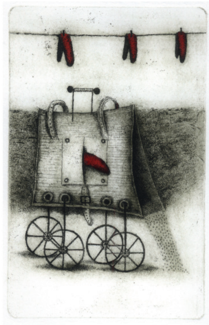
Podręczny seksik. 2015, C 3 + col., 146 x 94