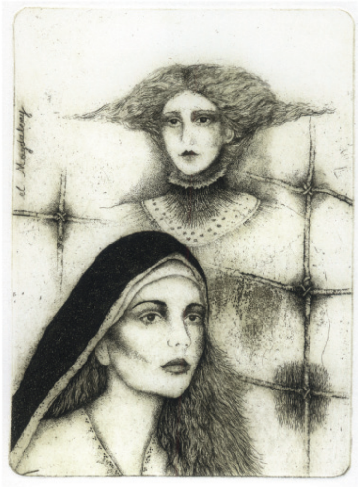
El Magdaleny. 2010, C 3, 129 x 95