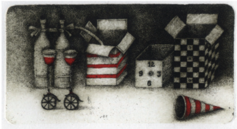
Smakowity tandem. 2010, C 3 + col., 49 x 92