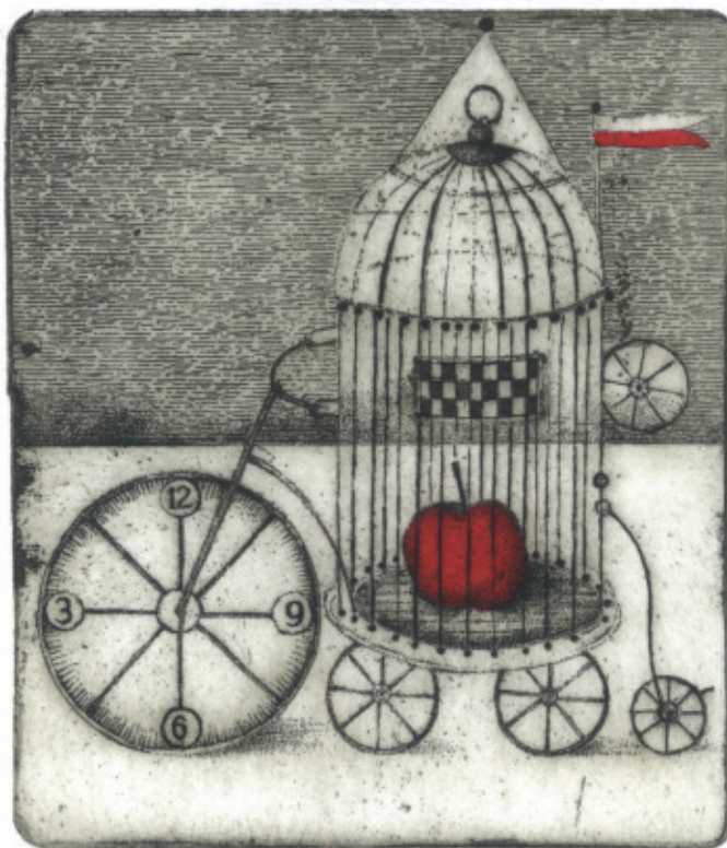
Dobrego czasu. 2012, C 3 + col., 99 x 86