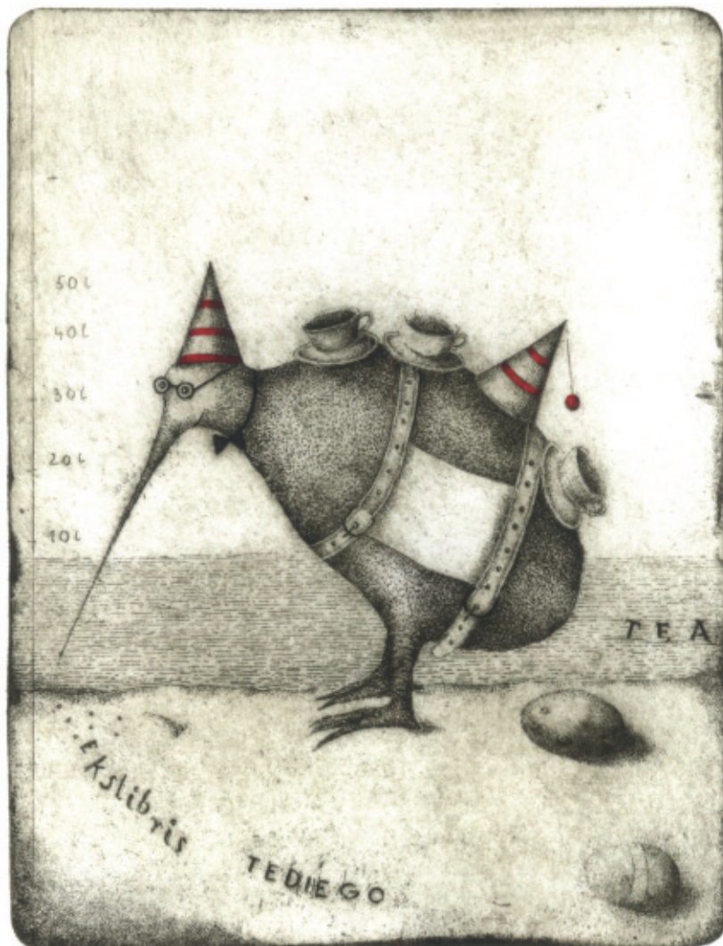
Ekslibris Tediego. 2006, C 3 + col., 139 x 107