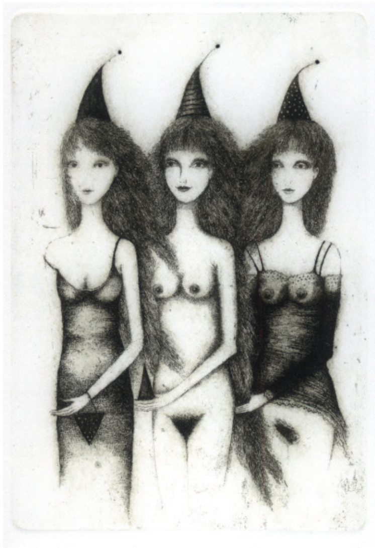
Muzy z Chamonix. C 3, 142 x 99