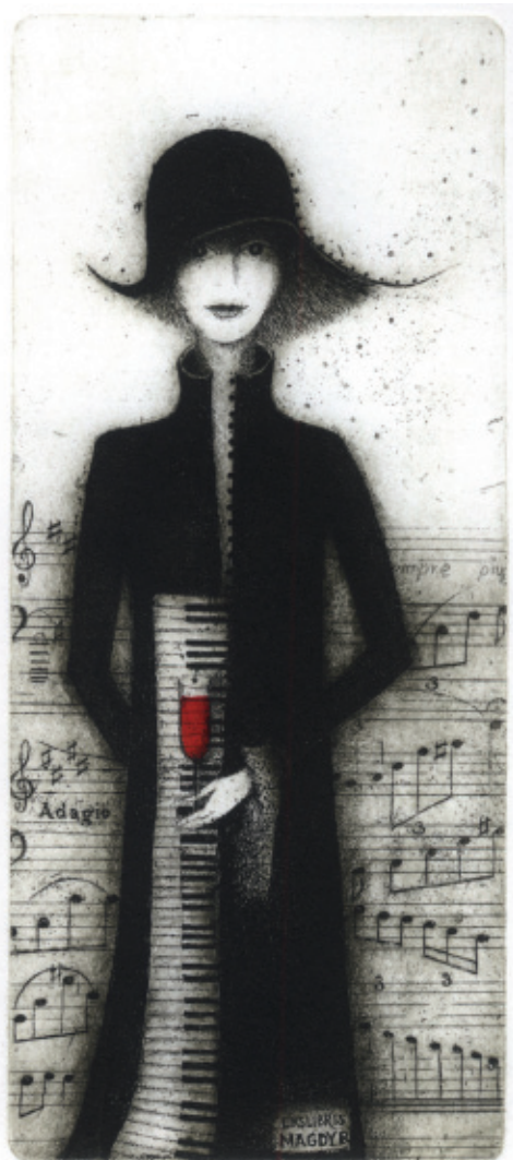
Ekslibris Magdy R. Pianistka . C 3 + col., 175 x 76