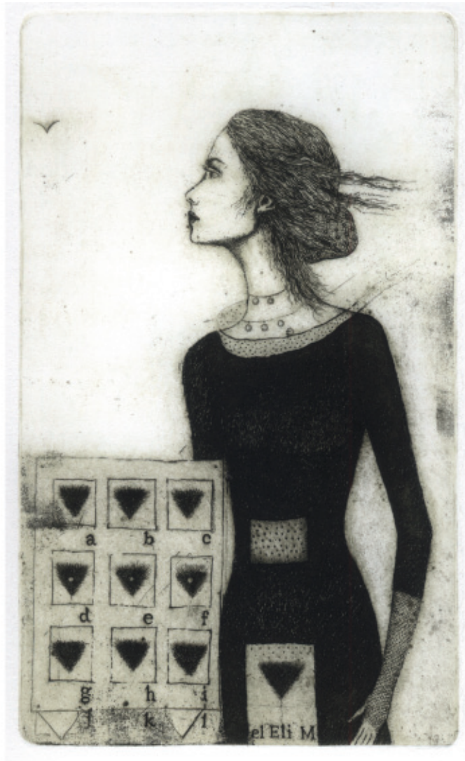
El Eli M. Abecadto . C 3, 169 x 103