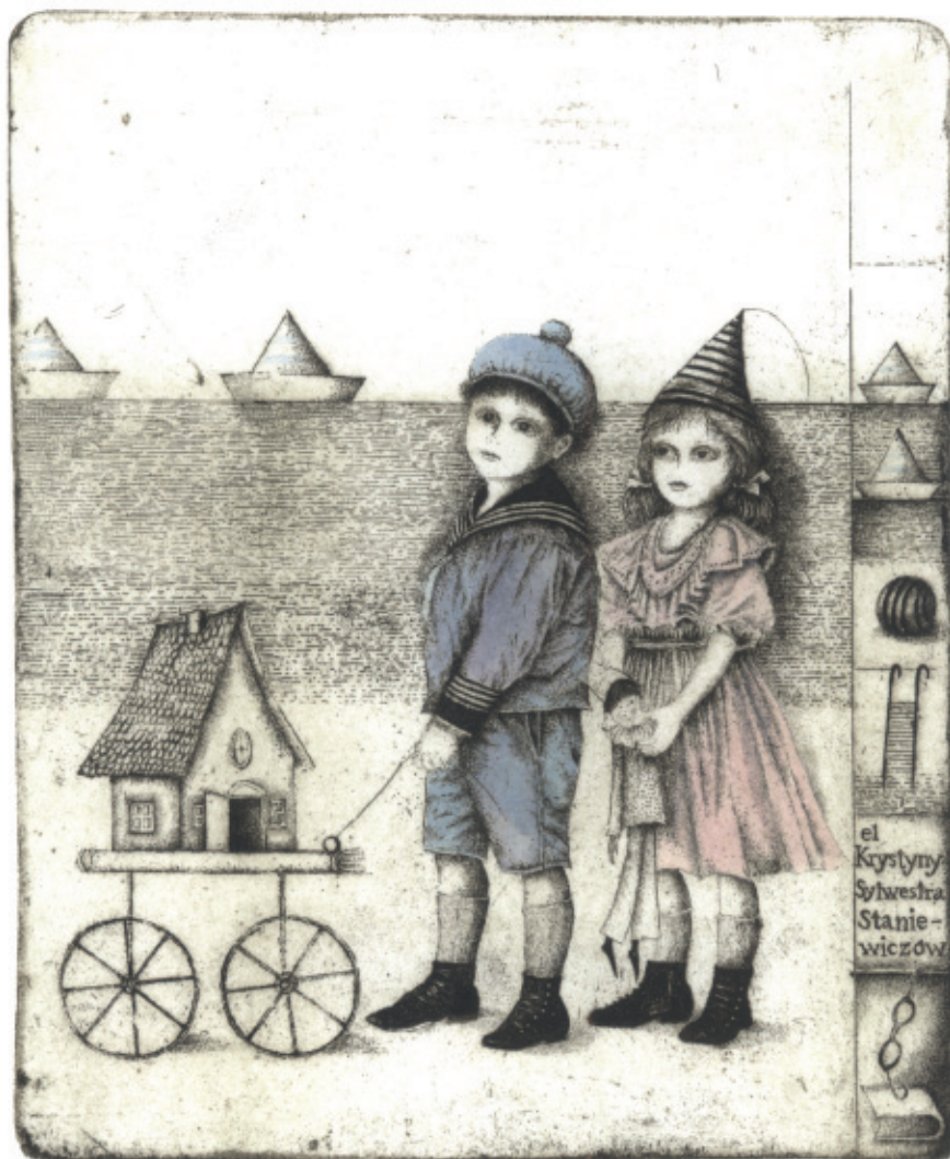
El Krystyny, Sylwestra Staniewiczów. C 3 + col., 157 x 128