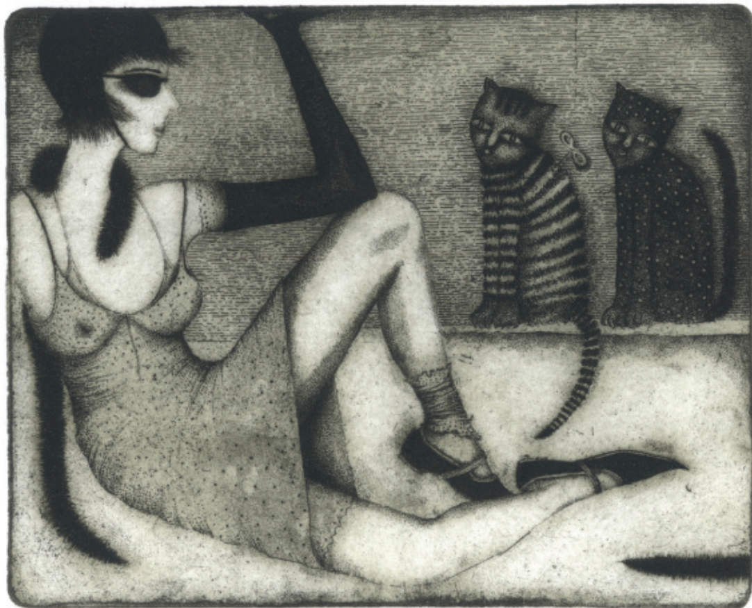
Kocie boa. 2005, C 3, 120 x 149