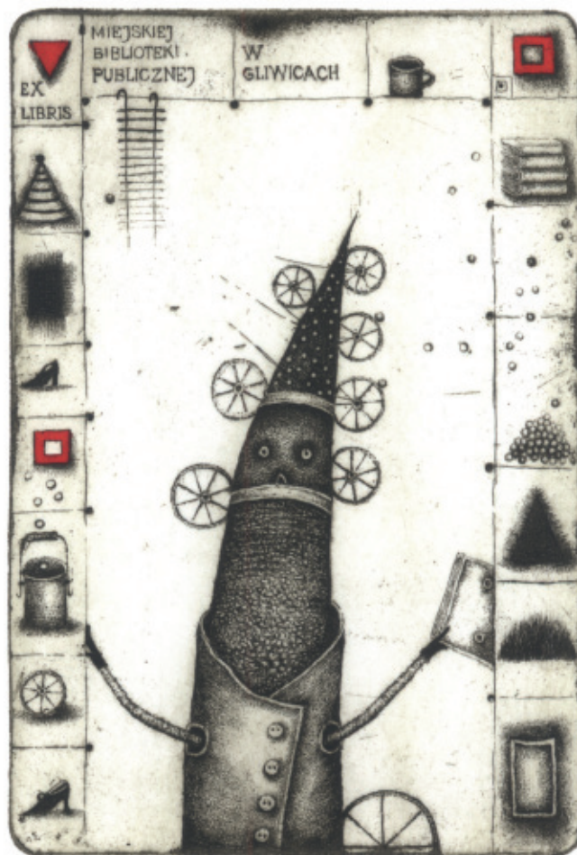
Ex libris Miejskiej Biblioteki Publicznej w Gliwicach. 2004, C 3 + col., 119 x 80