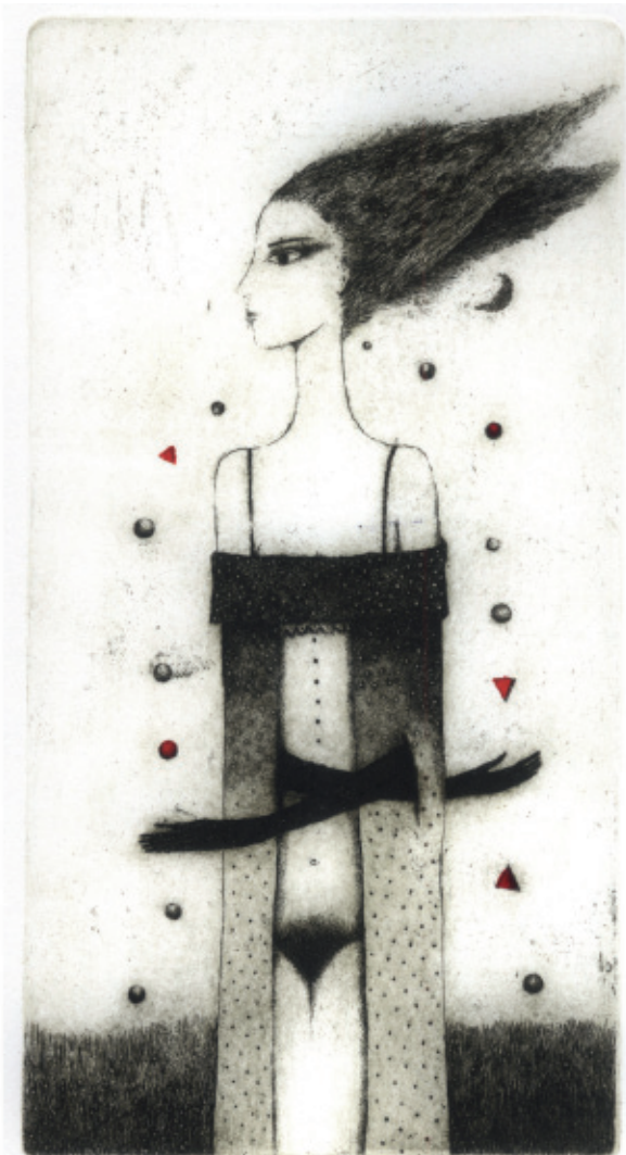
Žonglerka. C 3 + col., 186 x 99