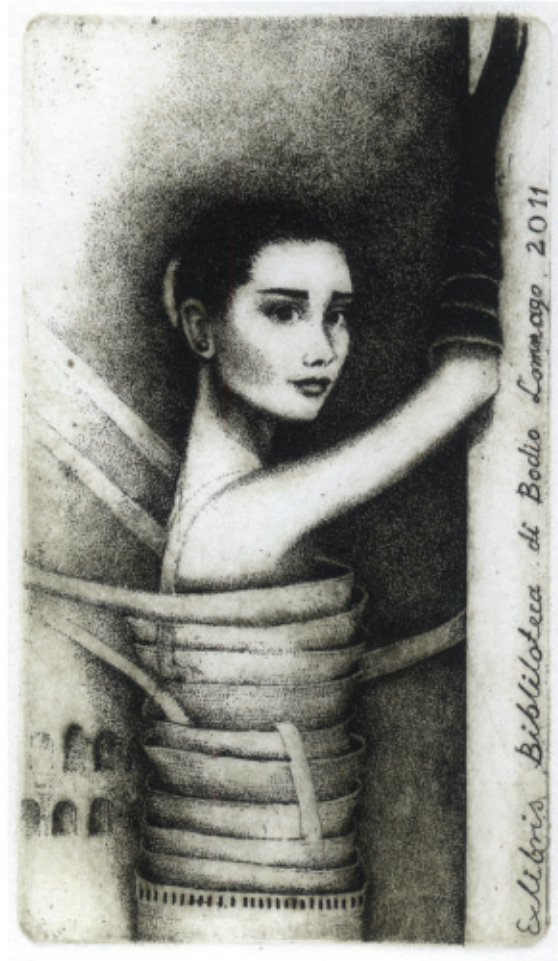
Exlibris Biblioteca di Bodio Lomnago. Audrey . 2011, C 3, 117 x 67