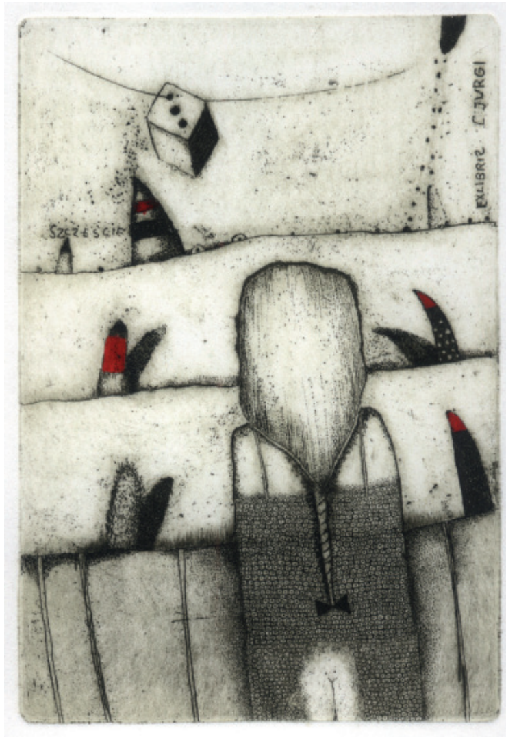
Exlibris J. Jurgi. 1999, C 3 + C 4, 124 x 85