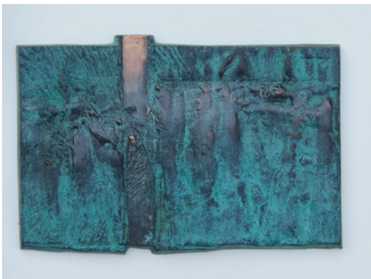
Tors , technika własna, 100x70 cm, 2016