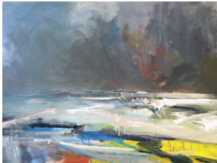
Pejzaż I z cyklu Pejzaże polskie, akryl, płótno, 35x25 cm, 2016