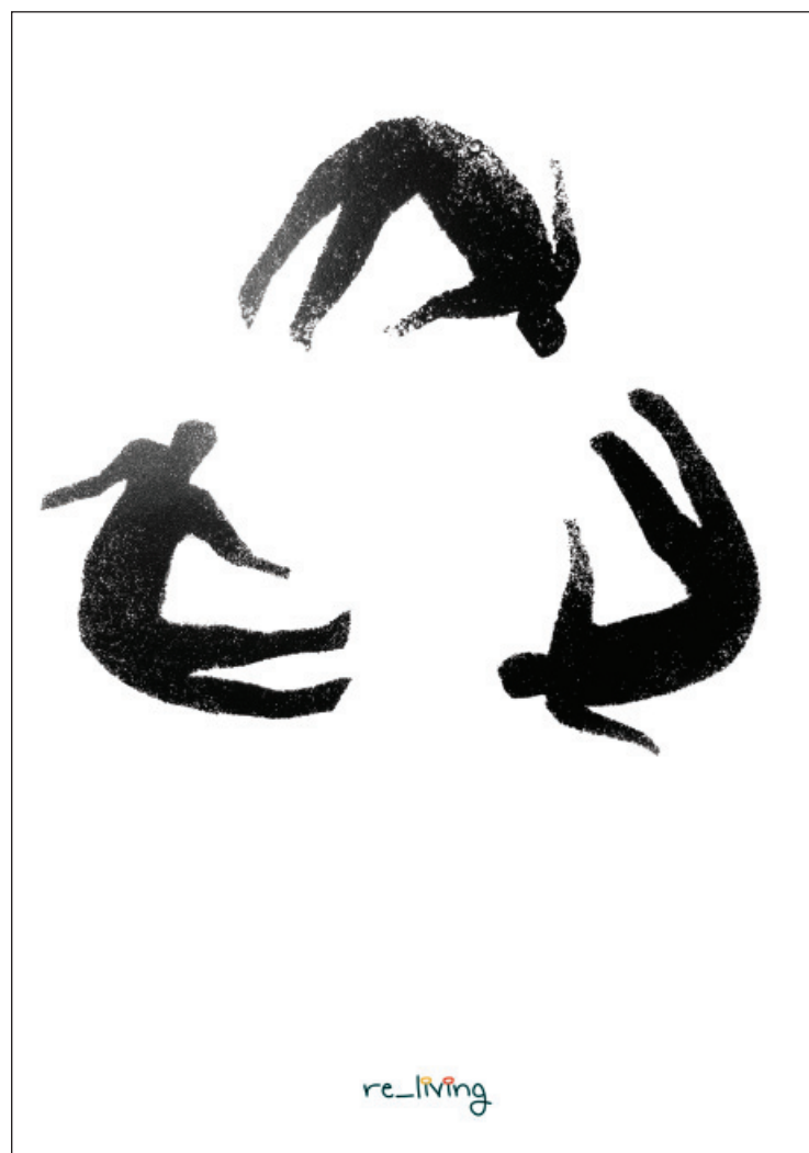
Homo homini politicus , druk cyfrowy, 100x70 cm, 2012