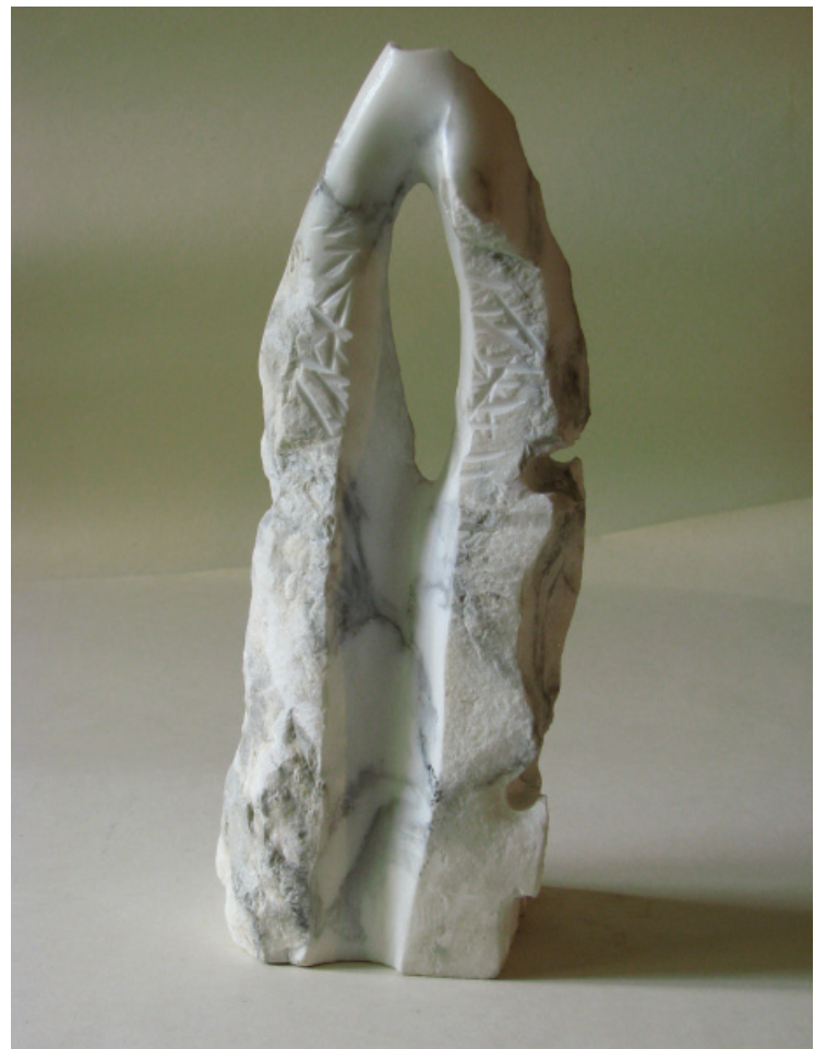
Makieta III , marmur, metal, 2017