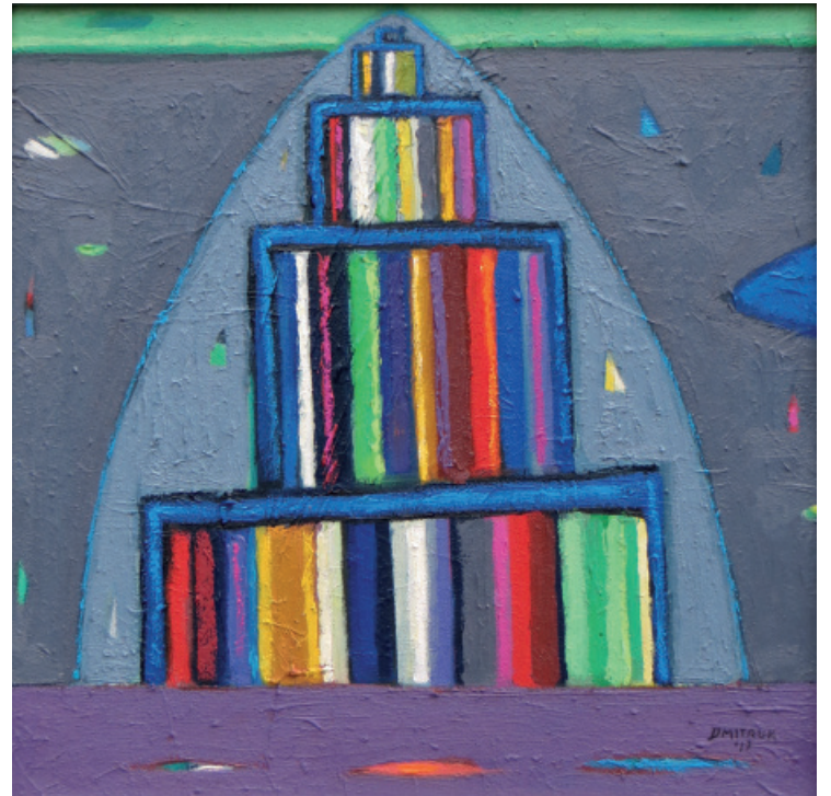
Pejzaż mojej okolicy , olej na płótnie, 60x80 cm, 2012