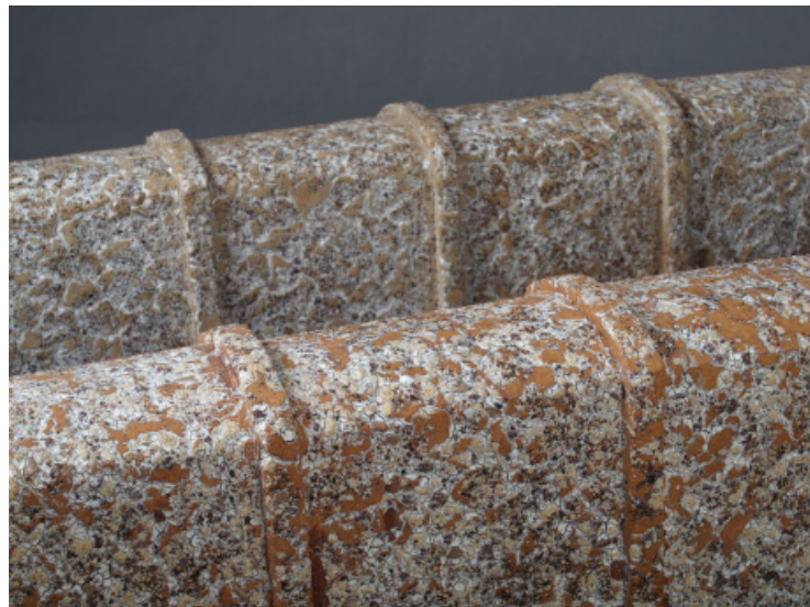
Transilvania I , masa szamotowa, kamionka barwiona, szkliwo, wypał raku, 4x49x8 cm, 2017