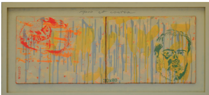
Instalacje/Obiekty , wystawa indywidualna, Galeria Sztuki Współczesnej, Opole 2011