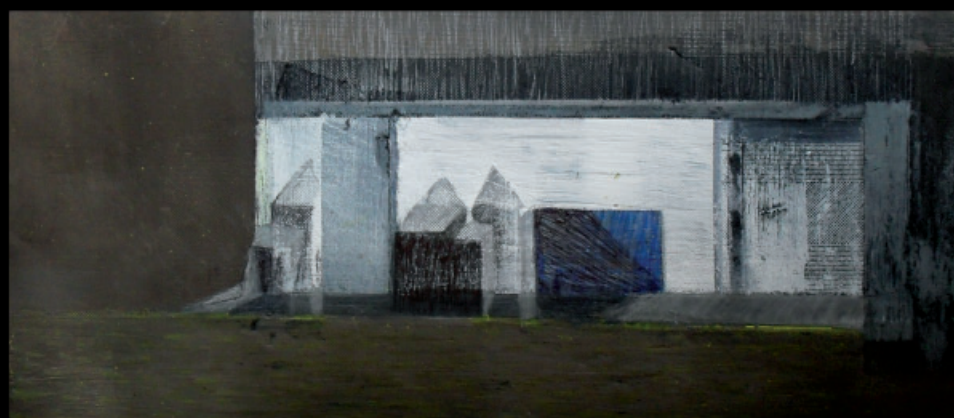
szkic Okno , technika mieszana, papier 10x23 cm, 2012