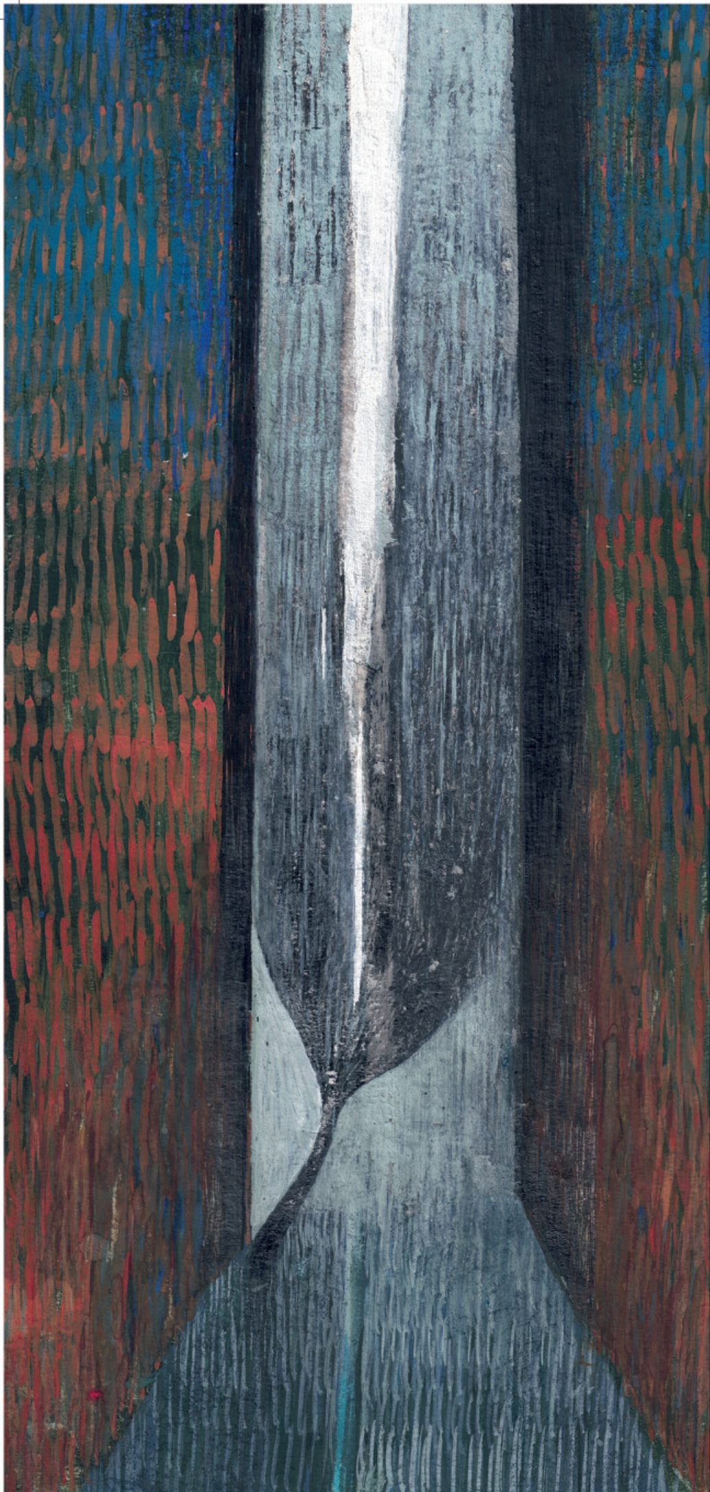
5 szkic do Forty , technika własna, papier/oprawa 35x23 cm, 2019